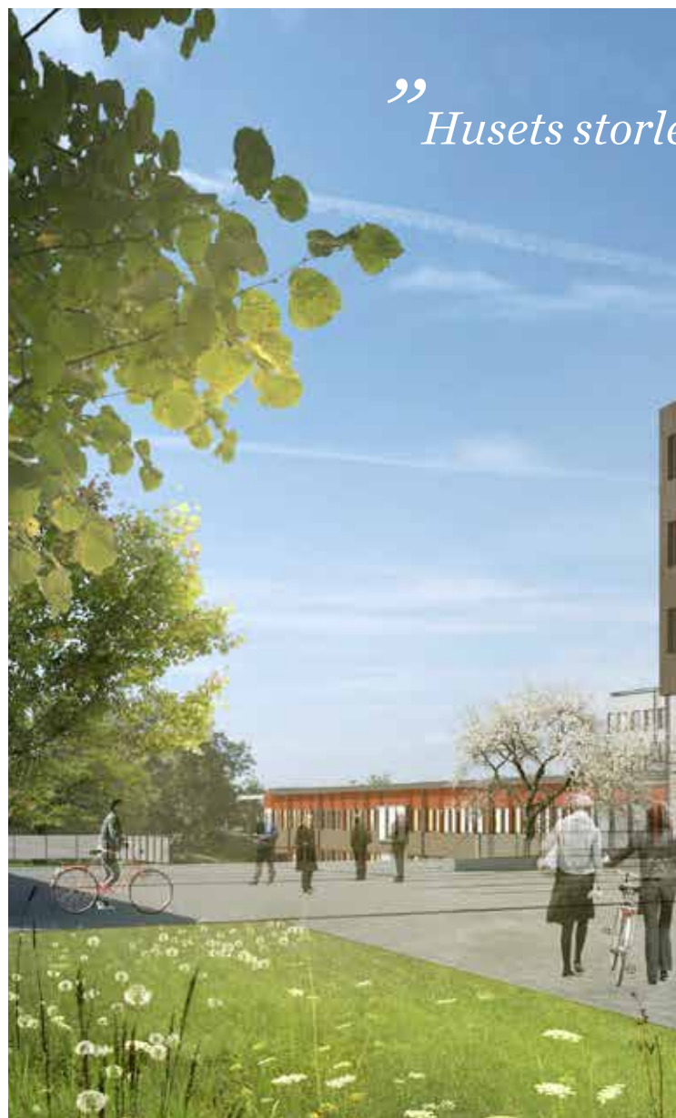
Entrédelen av huset får en stomme huvudsakligen av massivt trä

– Det är en modern och framtidsinriktad kunskapsmiljö som växt fram i Ultuna. Området har förtätats och en stadsmässighet har skapats i universitetsmiljön. Tillsammans med universitetet har vi också haft ambitionen att utveckla området till ett grönt campus. Den centrala parkmiljön vid Almas allé tillsammans med ek-alléerna och det gröna stråket längs Ulls väg kommer att sätta sin prägel på hela området. Kunskapsparken och grönområdet ned mot Fyrisån förstärker detta intryck.