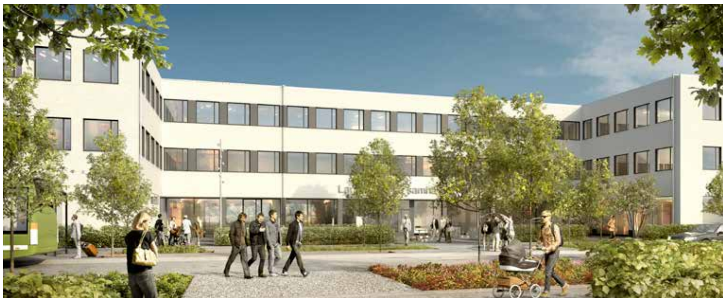
Ulls hus består delvis av ett lågt och vackert vitputsat hus. De stora glaspartierna nertill skapar en öppen och ljus inomhusmiljö.

– Att vi får ett högt hus med sex våningar och trästomme på vårt campus är extra roligt. Husets roll som huvudentré är spännande liksom de båda portikerna som leder in på gården och inte minst Ulls gränd som öppnar nya stråk i området, säger Marianne Fredriksson.